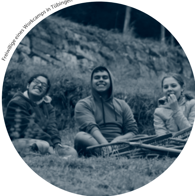
Freiwillige eines Workcamps in Tübingen

Weil die Auswertung der Fragebögen einen Testlauf darstellte, können aus den Ergebnissen zwar erste Schlüsse gezogen werden, welche jedoch nur Tendenzen darstellen, da sich die Auswertung auf Fragebögen nur weniger Camps und aus nur einer Workcamp-Saison bezieht.