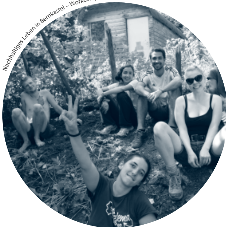
Nachhaltiges Leben in Bernkastel – Workcamp 2017

Abgesehen von Ausnahmen, zeigten sich die meisten Freiwilligen in den internationalen Camps interessiert und motiviert, was auch Campleitende und Projektpartner bestätigt haben. In den Fragebögen der Teilnehmenden wurden die Erfahrungen in der internationalen Gruppe und dem Projekt von allen als sehr bereichernd und wertvoll beschrieben.