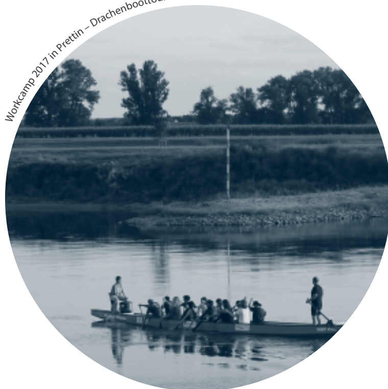
Workcamp 2017 in Prettin – Drachenboottour

Für alle Freiwilligen, die einen Freiwilligendienst im Globalen Süden – manchmal auch im Globalen Norden – antreten wollen, veranstaltet der SCl Vorbereitungs- und Rückkehrseminare: Für die Workcamper ein Vorbereitungs- und ein Rückkehrseminar, für die längerfristigen Dienste mehrere Vorbereitungs- und ein Rückkehrseminar(e). Geleitet wurden diese von jeweils sechs- bis siebenköpfigen Teams, die sich aus Aktiven der Nord-Süd-Arbeitsgruppe und der LTV-Arbeitsgruppe, aus gerade zurückgekehrten Freiwilligen sowie aus Referentinnen und Referenten aus der Geschäftsstelle zusammensetzen. Für die Seminare haben wir das Ziel, nach Möglichkeit für jedes Land, in dem ein Seminarteilnehmer oder eine Seminarteilnehmerin arbeiten möchte, einen Ansprechpartner oder eine Ansprechpartnerin zu finden.