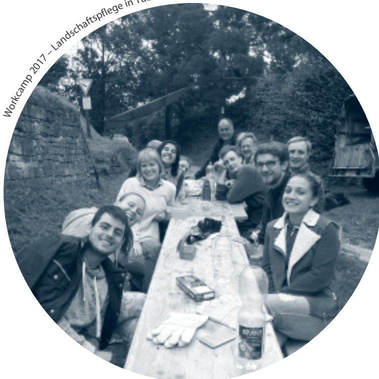
Workcamp 2017 – Landschaftspflege in Tübingen

Auch bei langfristigen Freiwilligendiensten mit einer Dauer von mindestens sechs Monaten bis zu einem Jahr unterstützen die allein oder zu zweit eingesetzten Freiwilligen gemeinnützige Projekte, bringen ihre Ideen und Fähigkeiten ein und übernehmen Verantwortung. Hierbei lernen sie die Lebens- und Arbeitsbedingungen in einem anderen Land aufgrund des längeren Aufenthaltes wesentlich intensiver kennen. Durch den besonders engen Austausch mit den Menschen vor Ort, in den Aufnahmeprojekten und mit den Gastfamilien entstehen persönliche Beziehungen, die alle Beteiligten bereichern und auch nach Beendigung