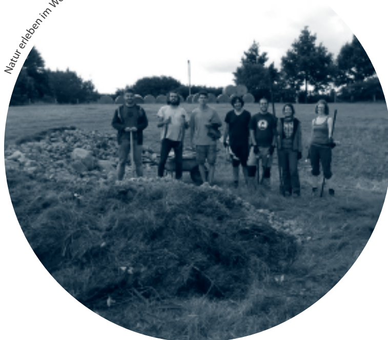
Natur erleben im Workcamp in Middelburg

Mit dem deutsch-französischen Kindergarten Au Clair de la lune e. V. in Magdeburg entstand aufgrund eines Kontakts zu einer ehemaligen Freiwilligen eine neue Kooperation. 2017 konnte eine EFD-Freiwillige aus Frankreich einen zwölfmonatigen Dienst antreten.